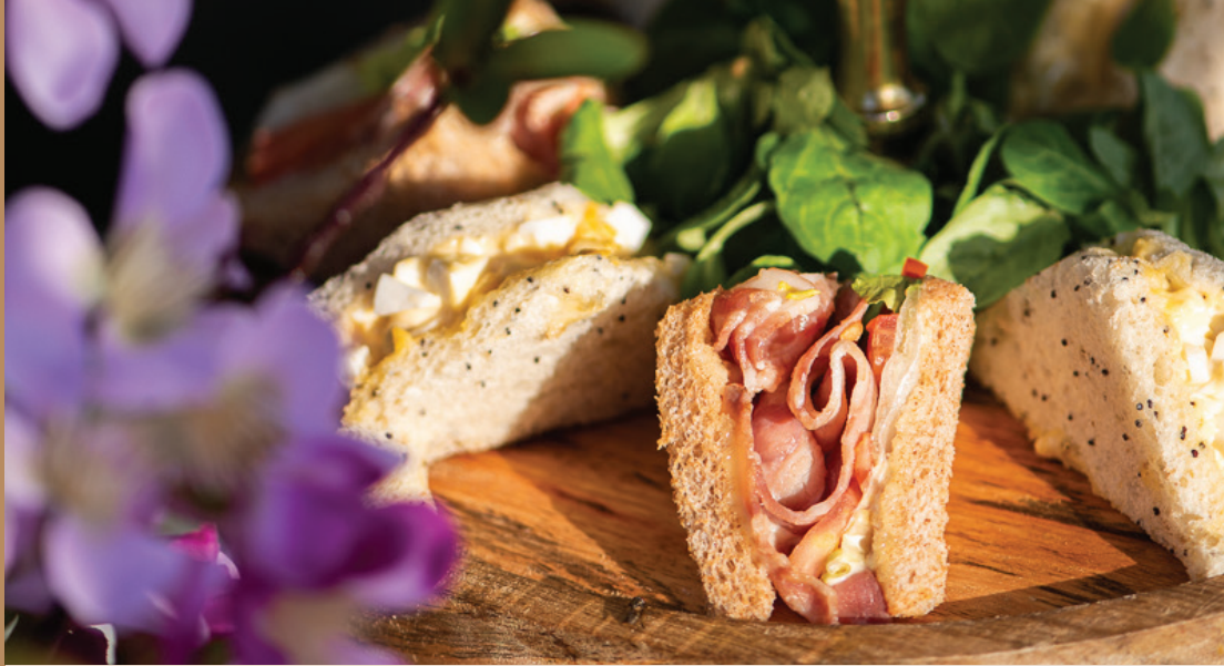
TABLA DE SÁNDWICHES: - €50 + IVA