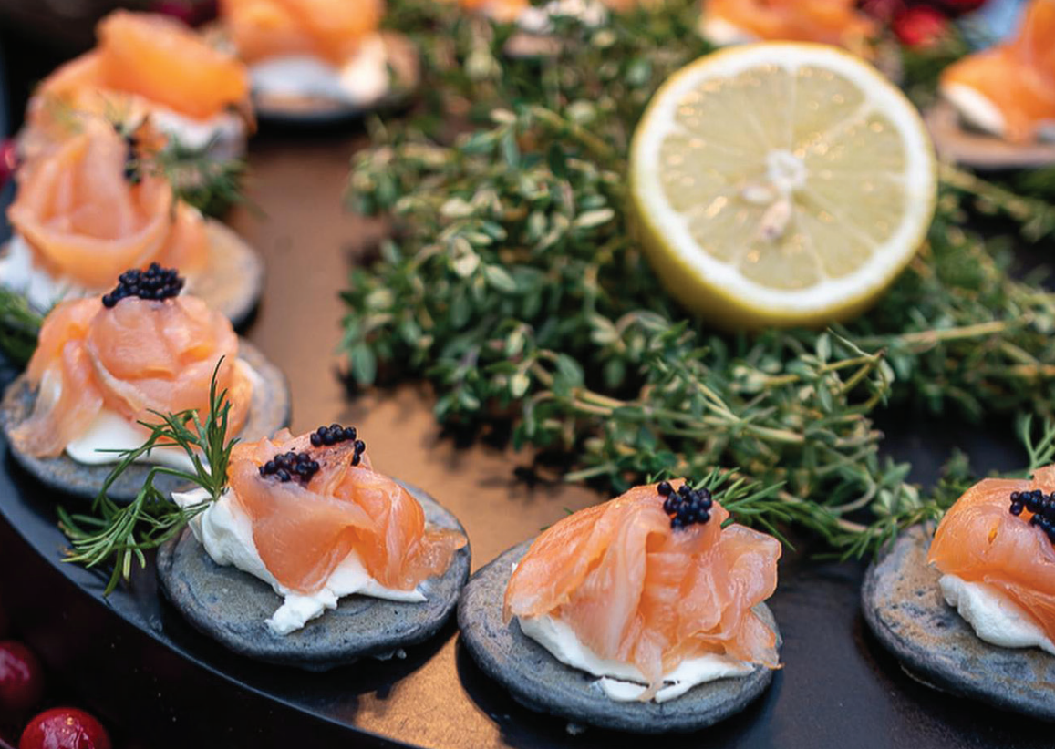
TABLA DE CANAPÉS BELLINI: €50 + IVA