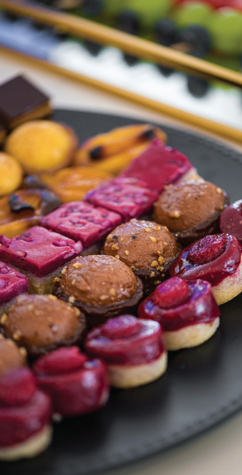
TABLA DE POSTRES SORPRESA - €50 + IVA