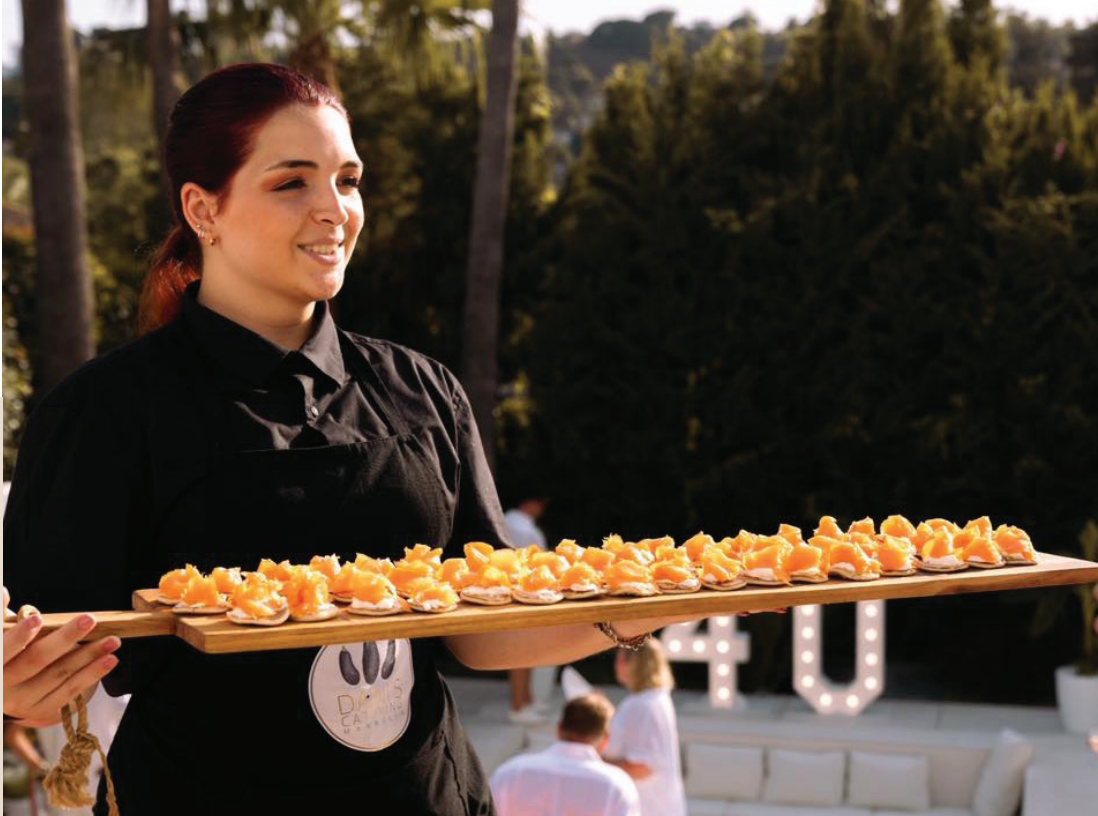
TABLA DE TAPAS - €75 + IVA